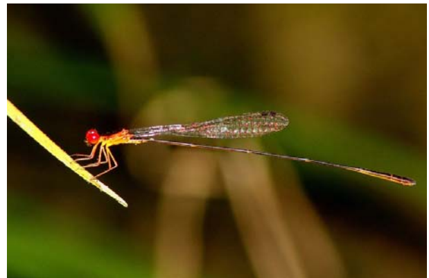
Mâle mature, photographié en Guadeloupe (Sainte Rose) en 2006 par Pierre Guezennec.

Connue au monde uniquement de la Guadeloupe et de Montserrat (endémique à ces deux îles). En Guadeloupe, cette espèce est rare et peu abondante, localisée aux étages de la forêt sempervirente saisonnière et ombrophile de la Basse-Terre jusqu'à 800m d'altitude. Les populations présentent une distribution discontinue avec un important noyau dans le Nord de l'île, puis des populations groupées sur le massif de la Soufrière. Très rare sur la Grande-Terre, où l'espèce est uniquement présente, par petites populations, dans les forêts marécageuses littorales, entre les Abymes et Petit-Canal à l'ouest, et dans les mangroves du Moule à l'Est.